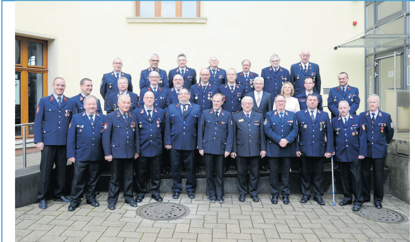
Mitglieder der Freiwilligen Feuerwehr wurden von Oberbürgermeister Klaus Lorig für ihre Verdienste geehrt

Für unverlangt eingesandte Artikel übernimmt die Redaktion keine Haftung.